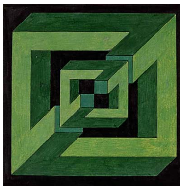
Figura imposible, boceto. 1970

IBM-Informatique Nº1. Paris 1970 Figures imposibles construites par un ordinateur.