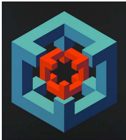
Figura imposible. 1972