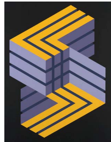
Figura imposible. 1973