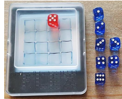
Elementos del juego. Imagen: Grupo Alquerque.

Es un juego para un jugador, que dispone de un tablero de 4x4 celdas, un juego de 7 dados azules y uno rojo y una colección de 80 retos.