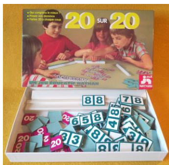
Imagen 1: Caja del juego. Grupo Alquerque.

Es un juego de estrategia abstracta, con fichas tipo dominó, ideado por Ediciones Fernand Nathan en 1978. Juego para 2, 3 o 4 jugadores que disponen de 54 fichas de dominó, desde blanca-uno (0-1) al doble nueve (9-9) y 45 marcadores de 20.