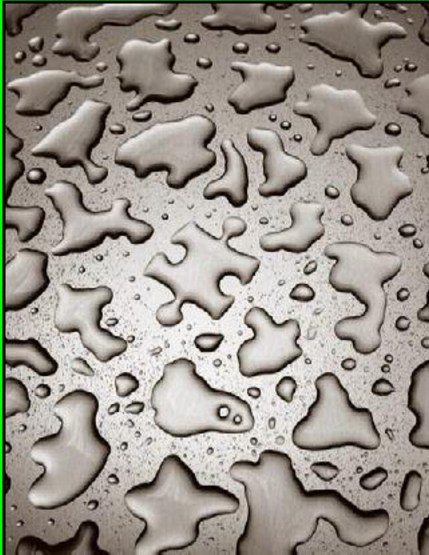
Puzzle agua (Chema Madoz)