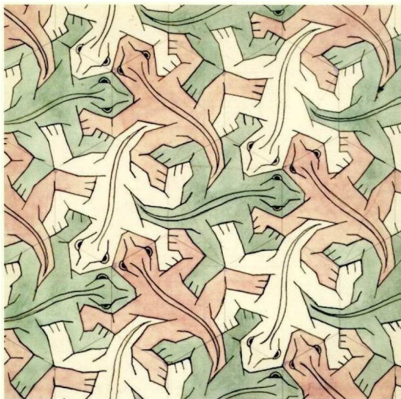
M. C. Escher Reptiles (tessellation 25) , 1939