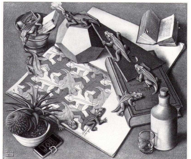
M. C. Escher Reptiles , 1943