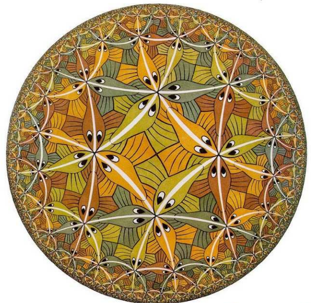
Aproximaciones al infinito