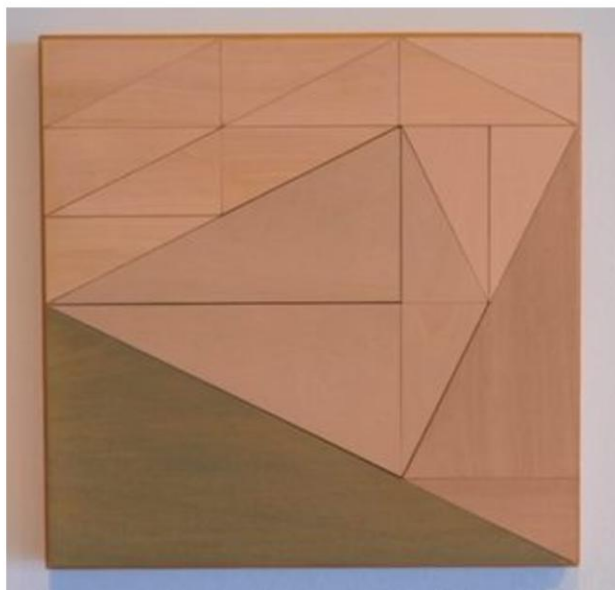
Broken Lights Series #61, 2017