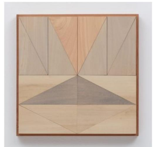
Broken Lights Series #51, 2017