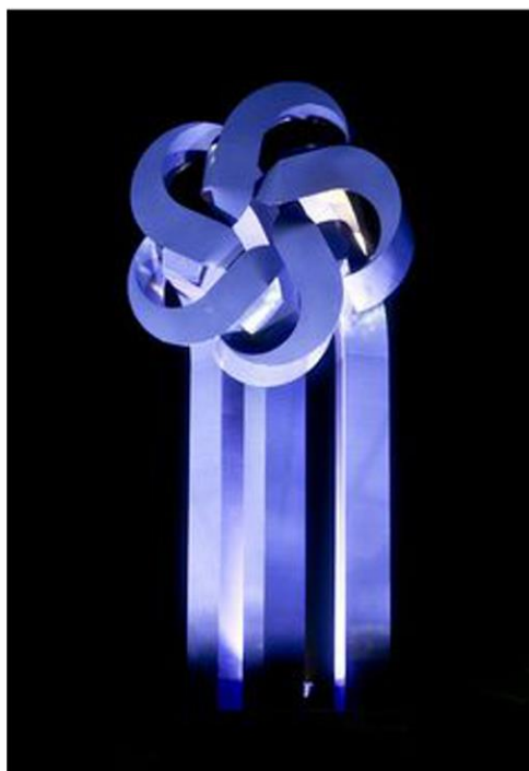
Flor del desarrollo