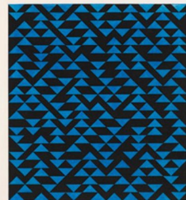
Triangulated Intaglio V, 1976