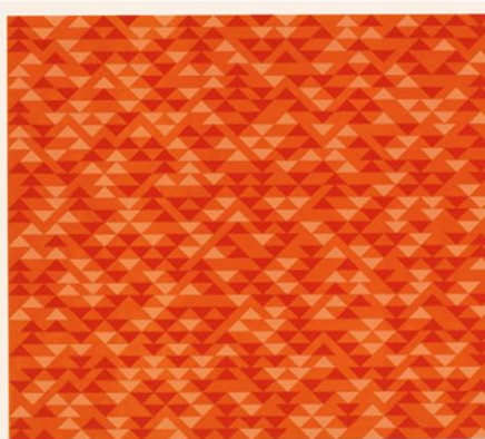
TR I, 1970