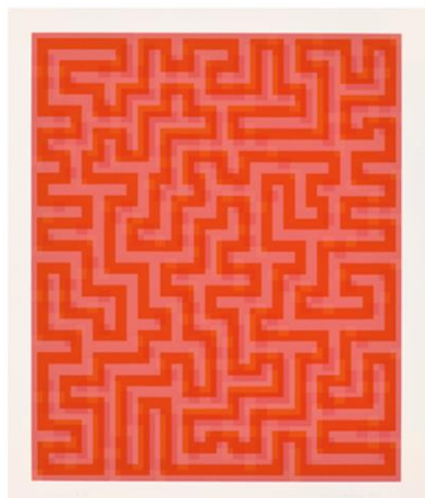
Red Meander I, 1969-1970