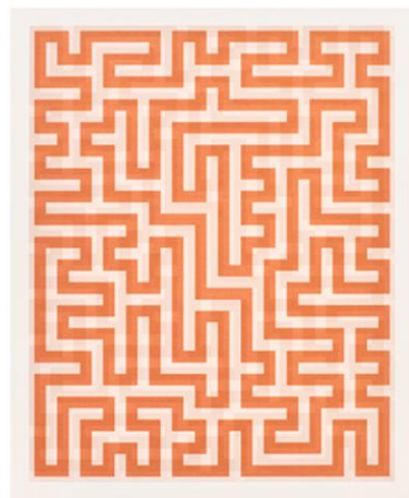
Red Meander II, 1970-1971