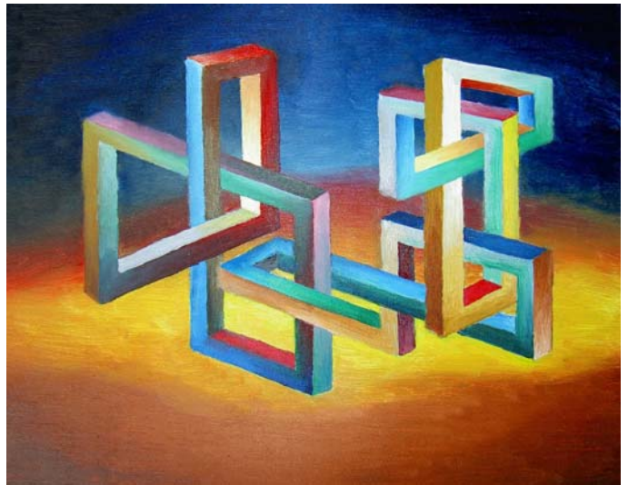
Three impossible loops