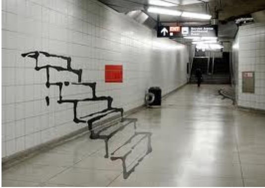
Panya Clark Espinal (1965, Canadá)