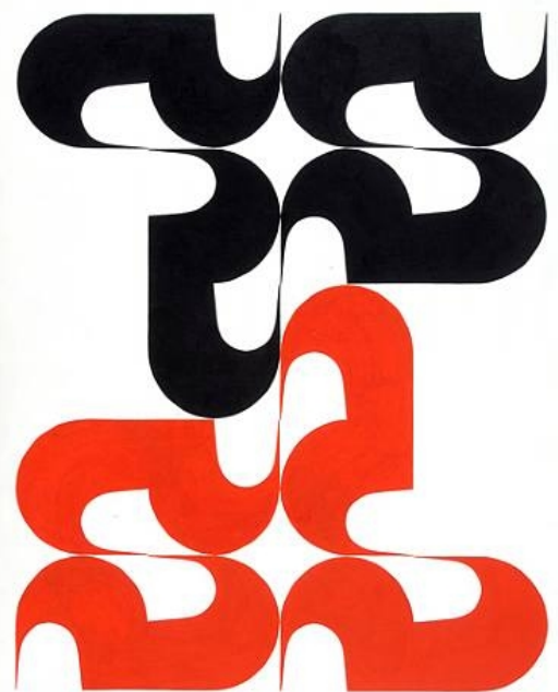
Blanco, Negro y Rojo. 1965