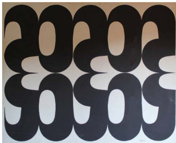
Composición con un módulo, 1966

Entre los años 1964 y 1968 trabaja con un único módulo, parecido a una U o en palabras de Barbadillo "como de gancho encerrado en un cuadrado", que a su vez se originó a partir de dos formas básicas, un cuadrado y un cuarto de círculo. Repitiendo este módulo U en distintas posiciones crea sus obras. Un ejemplo es la siguiente.