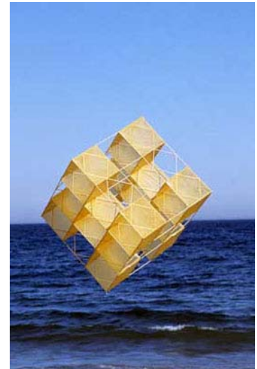
Estructura en vuelo, serie cubos. 1976