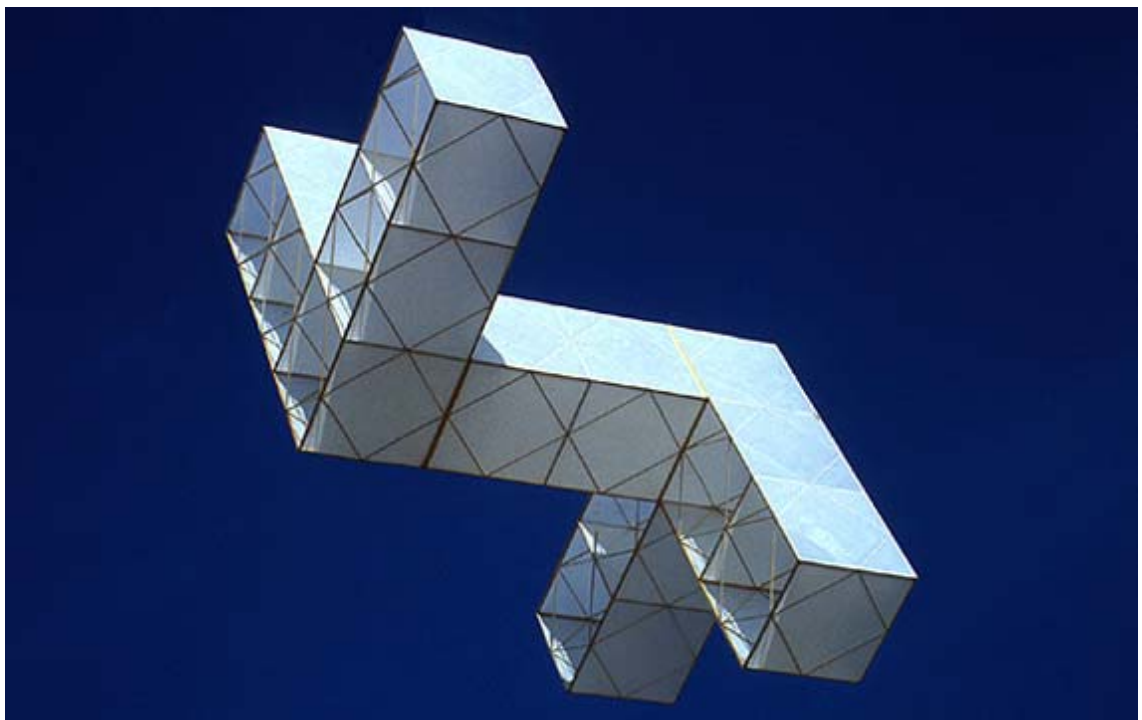
Homenaje a Velázquez. Estructura Volante. 1979