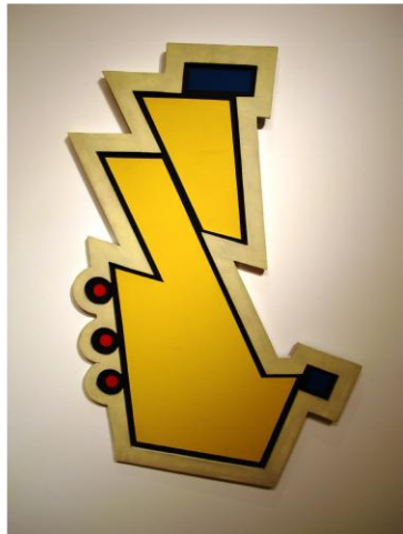
Tres círculos rojos. 1948