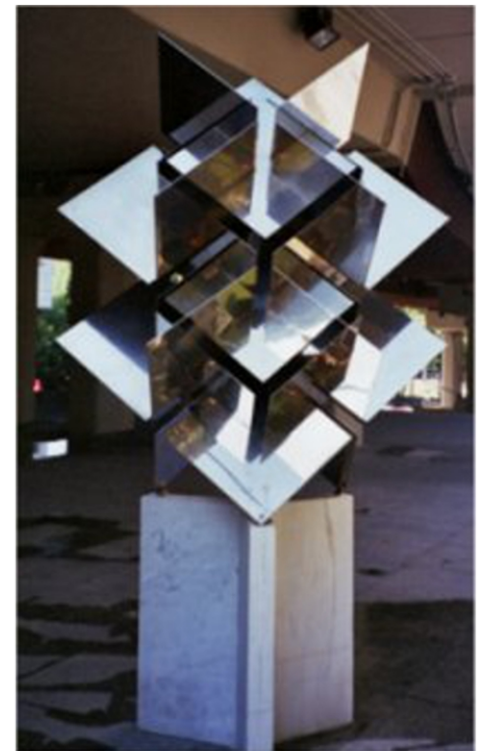
Estructura permutacional. 1996

Francisco Sobrino Ochoa (Guadalajara, 1932), pintor y escultor español, creador de obras cinéticas, siendo seguidor del artista húngaro Víctor Vasarely.