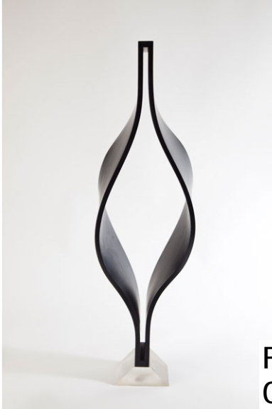
Escultura S/T. 1975