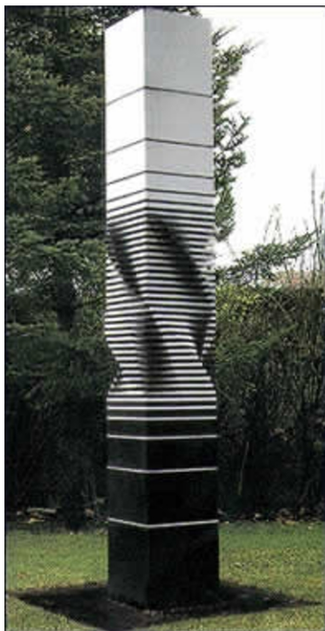
Rotación: relación blanco-negro G. 1991