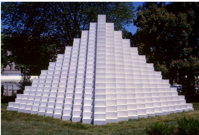
Four-Sided Pyramid, 1999