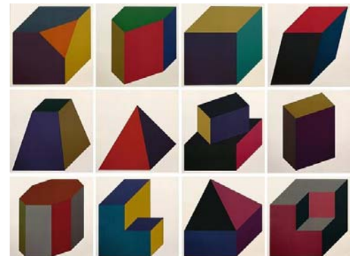
Forms derived from a cube, 1991